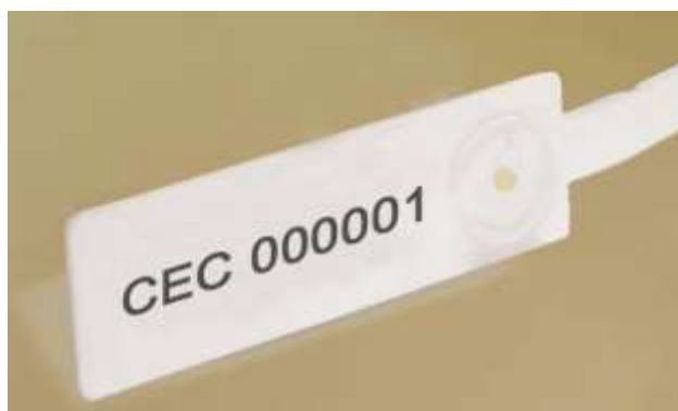
Figura nr. 9