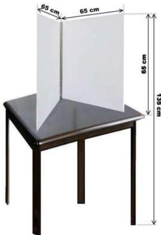
Figura nr. 2 Cabina de vot destinată persoanelor cu dizabilități