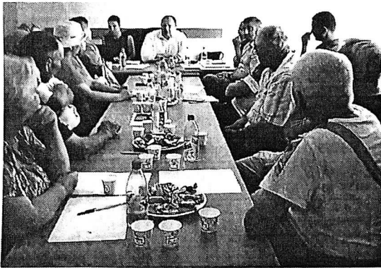
Consilierii comunei Biliceniei Vechi