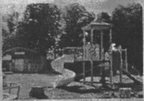
Teghenești, Teghenești: 80 de copii au acum condiții bune de educație, după ce a fost dotată grădinița din sat.

Guvernul suplimentar 300 de milioane de lei pentru dezvoltarea orașelor și orașelor.