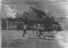
Băneasa, Sîngera: A fost construit teren de fotbal cu iluminat de 1600 de metri pătrați, de care acum se bucură circa 1300 de copii din orașul Sîngera și satul Băneasa.