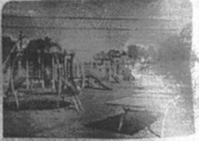
Bălănești, Căluț: Căcuț 900 de copii au acum acces la un teren modern de joacă și de sport. O investiție de circa 2 milioane de lei.