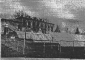
Sîrbuți, Brăncuși: A fost construită o sală foto-voltaică, la care au fost conectate gimnaziul, grădinița și oficiul medicilor de familie din sat.