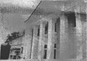
Cărpinești, Mîncești: Faza culturală a fost renovată capital - o investiție de 1,6 milioane de lei.