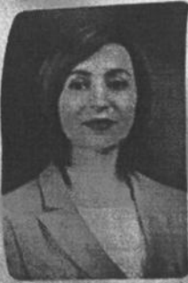
Președinta Maia Sandu anunță lansarea Programului Național "Satul European"

Acum un an, președinta Maia Sandu lansa programul național "Satul European", care a pornit la drum cu aproape 500 de proiecte de infrastructură în toată țara. Astăzi, avem aproape 200 de proiecte finalizate și un nou program "Satul European Express", pentru încă 400 de proiecte. Cu fiecare grădiniță și școală renovată, cu fiecare oraș conectat la apă potabilă, cu fiecare stradă modernizată, Moldova se apropie de Uniunea Europeană. Echipa de lucru de primari și consilieri PAS va ajunge cu asemenea proiecte europene în toate localitățile țării.