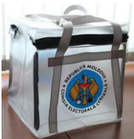
Figura nr. 6 Urna de vot mobilă