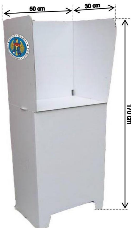
Figura nr. 1 Cabina de vot