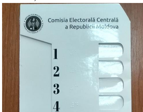
Figura nr. 3 Plic-șablon