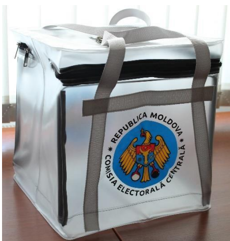
Figura nr. 6 Urna de vot mobilă