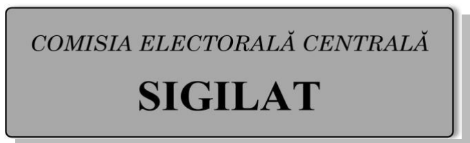
Figura nr. 9