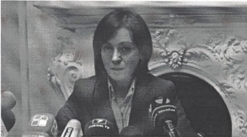
10:13 06.10.2016 Reprezentanții PAS, PPDA și PLDM, ședință până la miezul NOPTII. Ce decizie au luat în privința candidatului